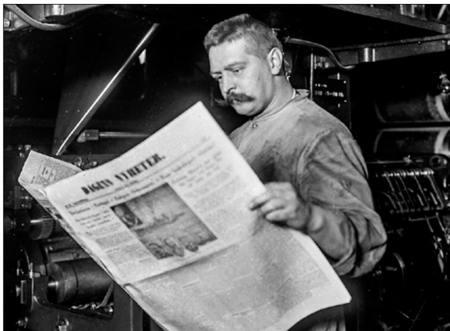
En man läser tidningen Dagens Nyheter år 1928. Tidningen har just blivit tryckt i den stora tryckpressen bakom honom.

Under andra världskriget fick inte svenska tidningar skriva vad de ville. De som skrev dåliga saker om nazisterna fick problem. År 1949 ändrades reglerna. Folk fick rätt att skriva och sprida texter fritt igen.