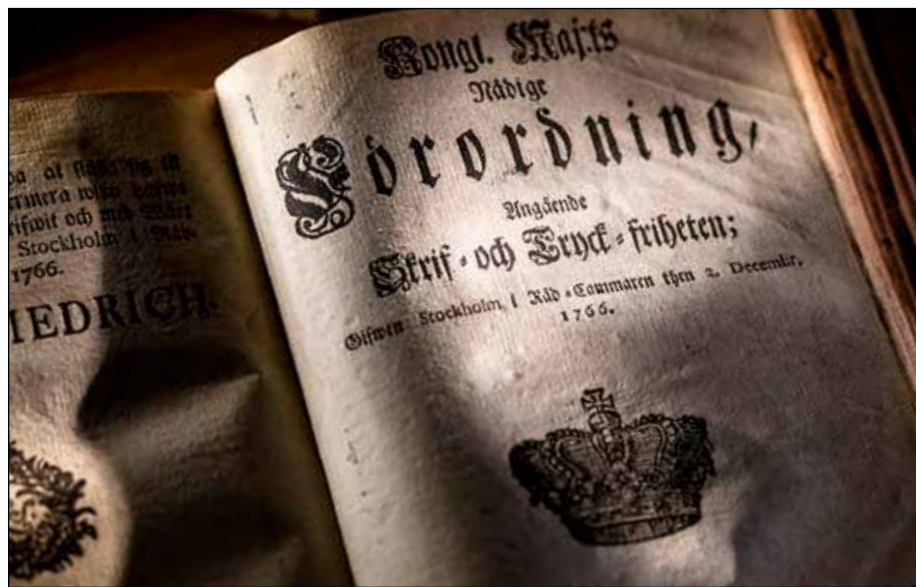
Så här såg lagen om tryckfrihet ut för 250 år sedan.

I början av 1800-talet var reglerna hårda. Flera tidningar stoppades. Men tidningen Aftonbladet kämpade emot. Varje gång tidningen stoppades bytte den namn. På så vis kunde den fortsätta att komma ut.