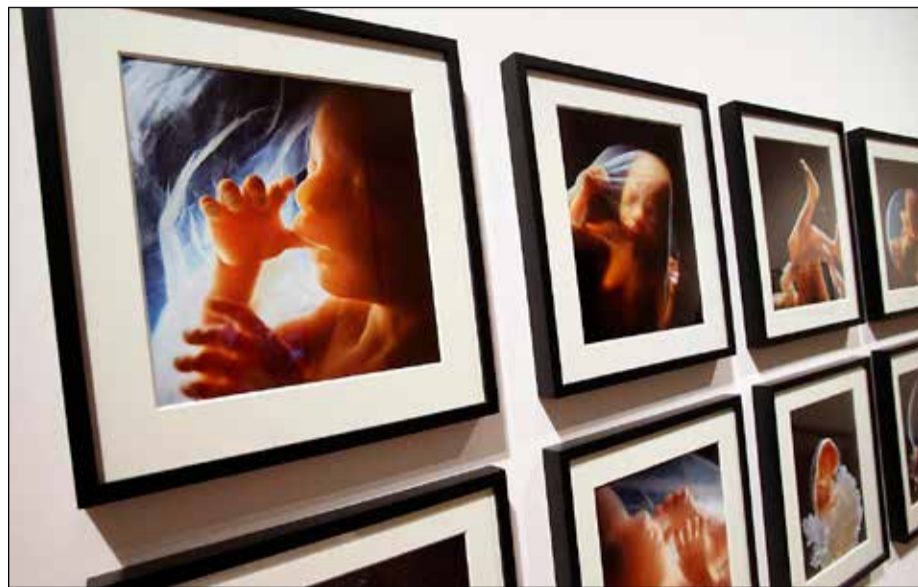
Lennart Nilssons bilder av ofödda barn har förundrat en hel värld.