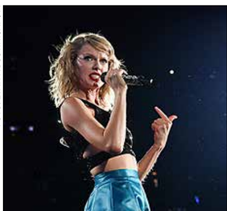
Artisten Taylor Swift är populär.

■ I förra veckan blev låten Blank Space med Taylor Swift den näst mest sedda på Youtube. Videon där Taylor Swift bråkar med en kille har setts över 1,2 miljarder gånger. Bara låten Gagnam Style med artisten Psy har setts fler gånger.