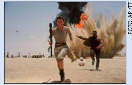
En bild från nya Star wars-filmen.