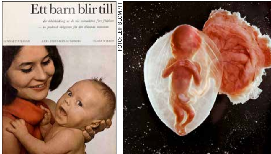
Så här såg boken "Ett barn blir till" ut när den kom för 50 år sedan.